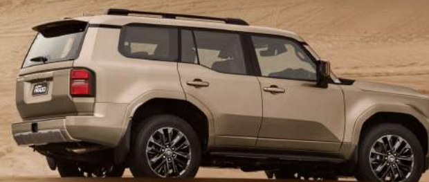
Versión VX y VX-L